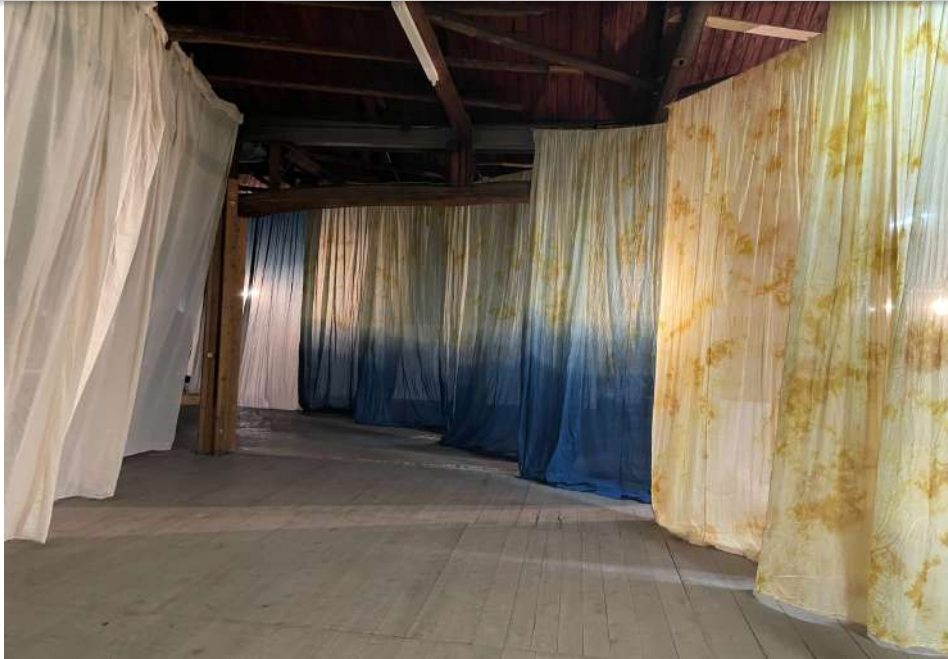
Love Song (2022)

2022年にパッハ、ラモーを中心としたプログラムで好評をいただいた『 Love Song 』コンサート、今秋も日本ツアーが決定しました。