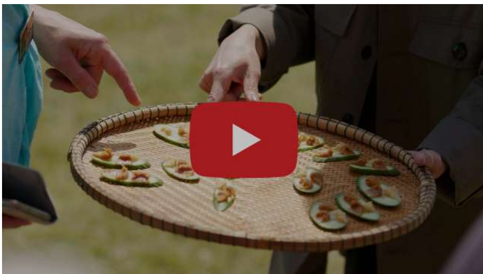
味噌ワークショップ (2022)

チケットは発売後1時間も経たないうちに完売。次回のニュースレターでパフォーマンスの様子をお知らせしたいと思います。